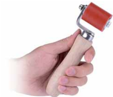
Figura 1 . Rullo a pressione manuale