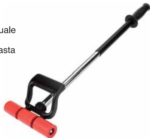
Figura 2 . Rullo a pressione con asta